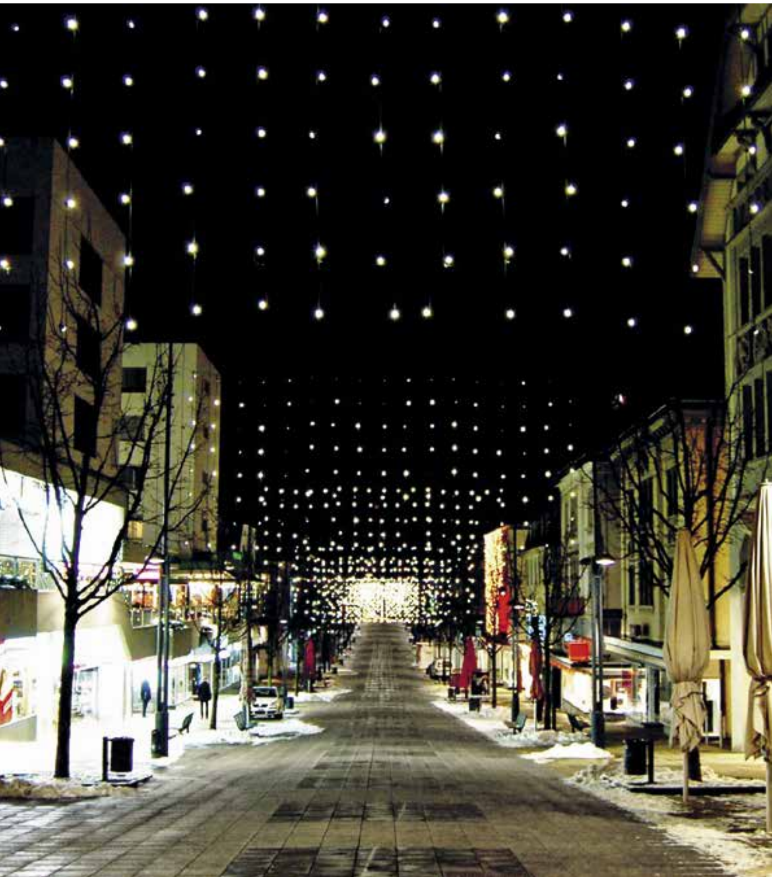
Bei Mietobjekten ist grundsätzlich der Vermieter für die Schnee- und die Eisbeseitigung zuständig. Für öffentliche Werke wie Strassen und Trottoirs (Bild) haftet hingegen das Gemeinwesen.