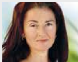
Angela Bernetta Aceti Online-Redaktion