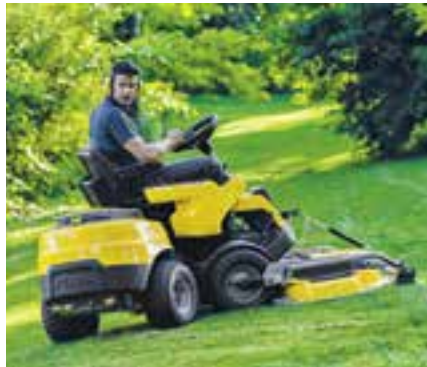
«Stiga Park Pro 740» – multifunktionaler Geräteträger.

Anlässlich der jährlichen Händlertagung konnte die ILSEBO Handels AG, Wislikofen, einige News aus dem Hause Stiga und Timan vorstellen.