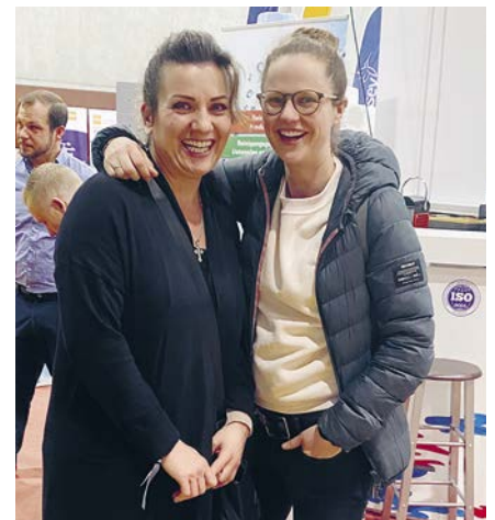
Die gut gelaunten Hauswartinnen der Primarschule Romanshorn prüften das umfangreiche Angebot an Rückensaugern. Beim Hersteller waren sich die beiden einig, klar ist aber: «Sicher ohne Kabel.»