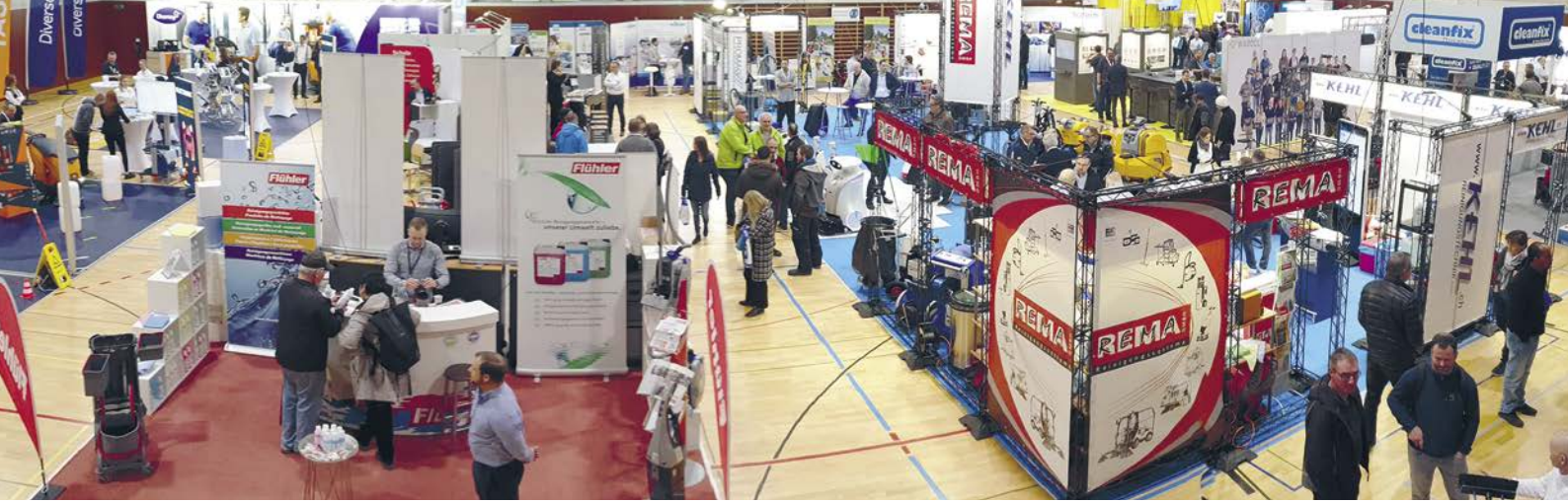
Viele namhafte Aussteller auf kompaktem Raum - dieses Messeformat kommt bei den Besucherinnen und Besuchern sehr gut an.